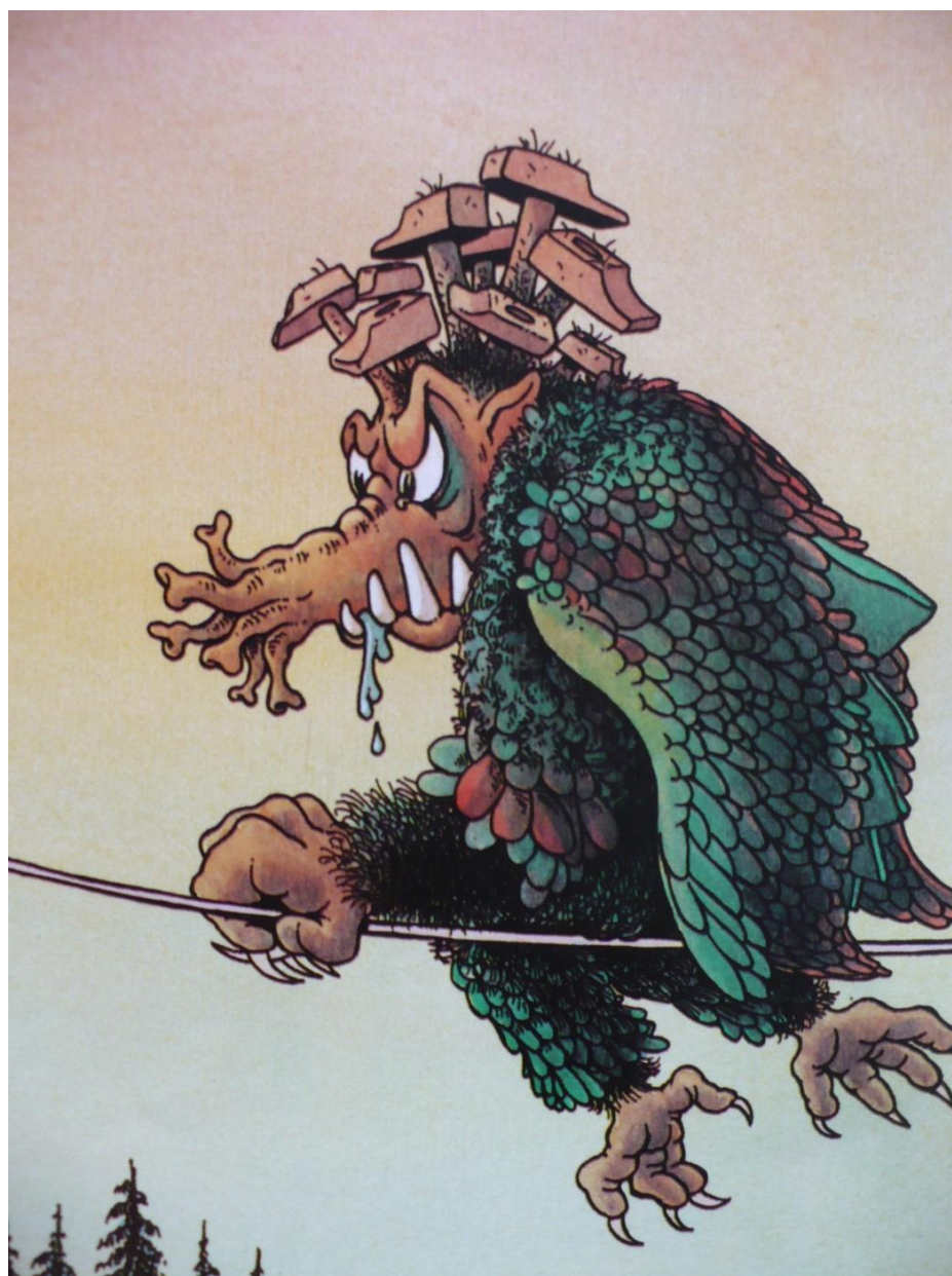
Okilélé , le monstre

Pour Claude Ponti, dire la vérité sur la cruauté du monde aux enfants est essentiel pourvu que les choses soient abordées avec des métaphores, de l'humour et de la fantaisie. Il vaut mieux aider les enfants à s'armer face aux personnes malveillantes ou des situations difficiles auxquelles ils vont devoir parfois faire face tout seul. Claude Ponti l'explique très bien lorsqu'il prend l'exemple d'un enfant à qui l'on ordonne de ne pas parler aux inconnus alors que les maltraitances sont commises à plus de 60% au sein de la famille. Il est nécessaire d'appeler les choses par leur nom. En montant Okilélé nous faisons le choix d'aborder des sujets rarement traités pour les jeunes enfants mais dont l'importance nous semble essentielle pour accompagner les enfants dans leur développement. Comme le dit Claude Ponti "A quoi ça sert de grandir si c'est pour rester petit !"