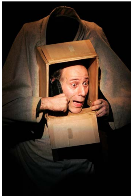
Zigmund follies , mise en scène Philippe Genty

A la suite du travail que nous avons mené dans notre précédent spectacle, nous envisageons pour réaliser les vidéos d'approfondir le développement de marionnettes vidéo en réalité augmentée qui pourront incarner Okiléle, sa famille et ses différentes rencontres. Proche de l'univers de Claude Ponti, elles seront inventées dans un esprit d'hybridation en mêlant les caractères physiques des humains, des animaux ou des objets. La plasticité de la vidéo nous permettra de nous approprier et de réinterpréter l'univers de l'auteur sur la scène dans toute sa complexité. De la même manière que Claude Ponti rend les enfants actifs devant ses albums illustrés en jouant avec les images et les mots qui parfois se répondent ou se contredisent, la vidéo nous permettra des allers-retours entre les mots et les images, d'ouvrir les portes de l'imaginaire et de plonger les enfants dans des mondes merveilleux qui, comme ceux de Lewis Carroll dont se réclame Claude Ponti, sont délicieusement bizarres.